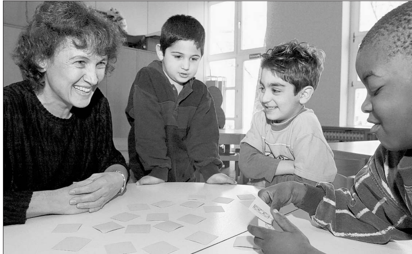
Ein Drittel aller Kinder in Deutschland haben ein Sprachproblem. Nur wer die Sprache früh genug erlernt, ist in der Grundschule gut.